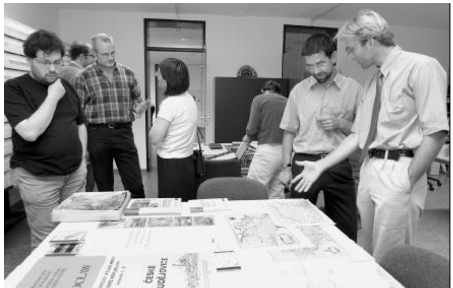
Teilnehmer der Sommerakademie bei einer Besichtigung im Bildarchiv des Instituts

Anliegen der Sommerakademie war, vor dem Hintergrund einer aktuellen Konjunktur biographischen Arbeitens, die sich nicht zuletzt auch in einer Reihe von im Entstehen begriffener akademischer Qualifikationsschriften ausdrückt, die theoretischen und methodischen Grundlagen und Prämissen zeithistorischer Biographik zu reflektieren. Der biographische Zugang stellt die Frage nach den Handlungs- und Gestaltungsspielräumen des Individuums in den jeweiligen politisch-gesellschaftli-