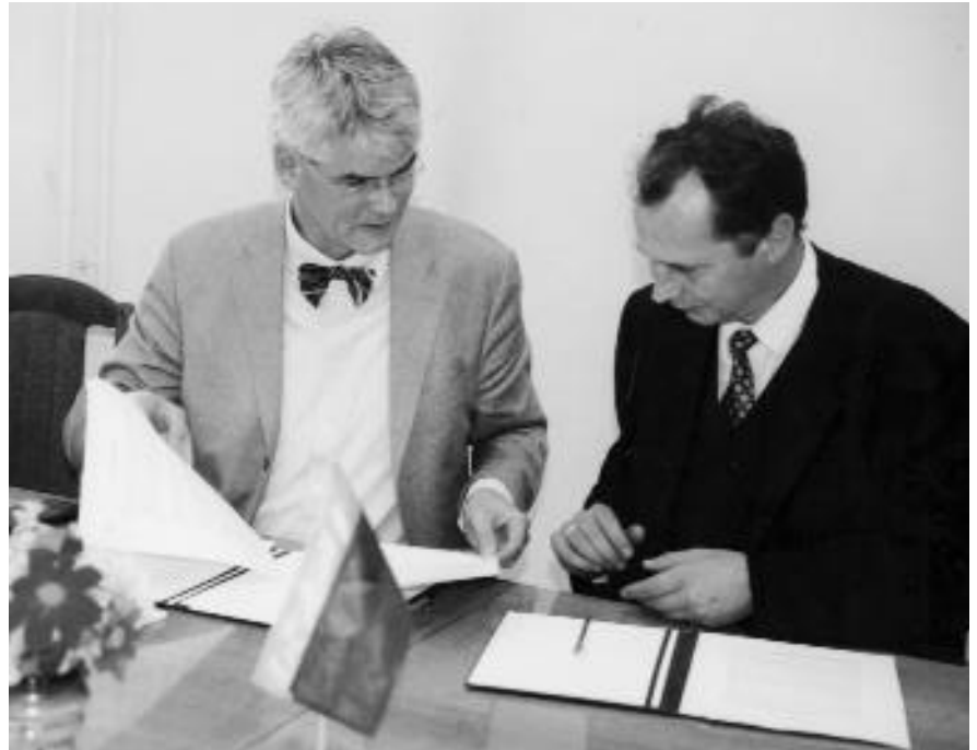
Vertragsunterzeichnung in Vilnius

Mit dem Abschluß zweier neuer Kooperationsvereinbarungen - zum einen mit dem Litauischen Historischen Institut in Vilnius, zum anderen mit dem Institut für Kunstgeschichte der Polnischen Akademie der Wissenschaften in Warschau - hat das Herder-Institut im August und September nicht nur das weitgespannte Netz seiner internationalen Kooperationsbeziehungen erweitert, sondern erstmals auch einen regelmäßigen direkten Wissenschaftlertausch mit zwei bedeutenden ostmitteleuropäischen Partnerinstitutionen vereinbart. In beiden Fällen ist vorgesehen, ab dem Jahr 2004 jährlich einen Personenaustausch im Umfang von zunächst jeweils einem Monat durchzuführen, der Wissenschaftlern des Herder-Instituts Forschungsarbeiten zur ostmitteleuropäischen Geschichte und Kunstgeschichte in Vilnius bzw. Warschau sowie je einem Vertreter des Litauischen Historischen Instituts und des Warschauer Instituts für Kunstgeschichte einen solchen Forschungsaufenthalt am Herder-Institut ermöglichen soll. Sofern die vereinbarten Austauschkontingente nicht von Angehörigen der beteilig-