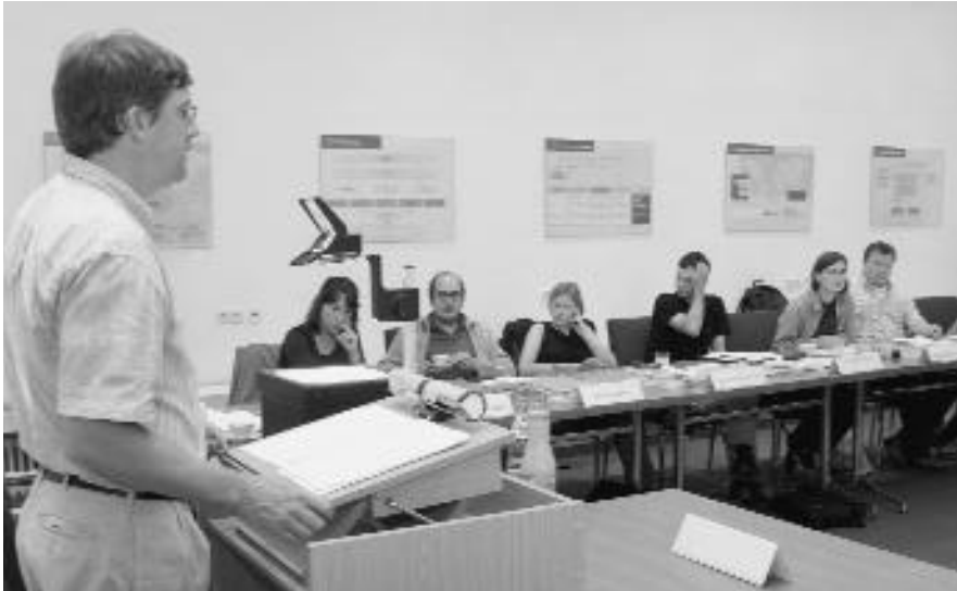
John Connelly/Berkeley (l.) referiert im Rahmen der Sommerakademie

Renaissance erlebt. Dieses gesteigerte Interesse ist nicht immer auch von einer ausreichenden methodologisch-theoretischen Fundierung des biographischen Ansatzes begleitet worden. Diese Beobachtung und das daraus abgeleitete Desiderat einer methodischen und praktischen Selbstvergewisserung hat die Sommerakademie aufgegriffen und einerseits in einer strukturierten Kursarbeit grundlegende theoretische und methodische Texte rezipiert und durchgearbeitet, andererseits die praktischen Probleme und Schwierigkeiten des Biographen zum Gegenstand ihrer Beratungen gemacht.