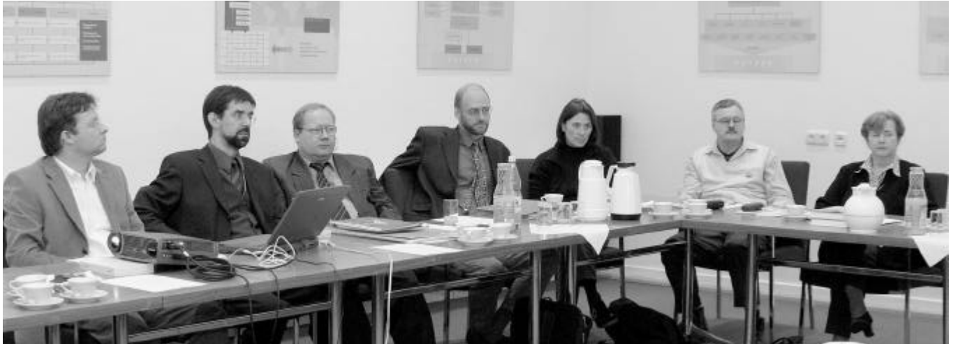
Teilnehmer der Diskussionsrunde

geführte Diskussion um "Perspektiven eines Internetportals für Historische Atlanten", indem er zunächst eine Auswahl meist räumlich begrenzter Projekte vorstellte, deren Karten entsprechend der jeweiligen Zielsetzung methodisch stark variierten. Um die historisch-thematische Kartographie als Arbeitsinstrument für verschiedenste Themen- und Zeitbereiche auch für vergleichende Studien einsetzen zu kön-