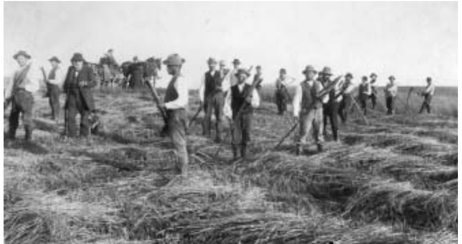
Erntearbeiten auf dem Gut Hochpaleschken

Sie stand im Zusammenhang mit einer Ausstellung des Herder-Instituts und des Brüder-Grimm-Museums in Kassel, die im Jahre 1997 zuerst in Marburg und Kassel, anschließend in Warschau und Danzig gezeigt wurde. Der Photoausstellung aus dem im Herder-Institut bewahrten Nachlaß des westpreußischen Gutsbesitzers Alfred Treichel (1837-1901) wurde ein Katalog beigegeben, der in Polen und speziell in der betroffenen Region auf reges Interesse stieß und in einen immer enger werdenden Gedankenaustausch mit den dort beheimateten Wissenschaftlern mündete. Aus diesen Kontakten erwuchs nicht nur die Idee, die Ausstellung auch im Kaschubischen Freilichtmuseum in Wdzydze zu präsentieren, sondern zu diesem Anlaß auch eine Konferenz durchzuführen, deren Ergebnisse in dem nunmehr