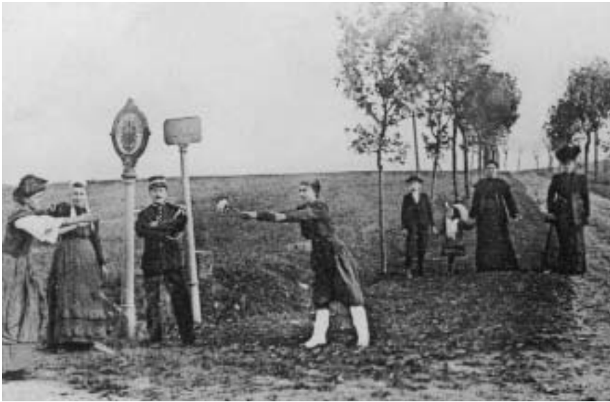
Aus: GrenzenLos , Katalog zur Ausstellung Historisches Museum Saar 1998

Der vorliegende Band, hervorgegangen aus einer Sektion des 43. Deutschen Historikertages in Aachen im Jahr 2000, entfaltet bei der vergleichenden Analyse von Nationalisierungsprozessen in sprachlich gemischten Grenzregionen ein breites regionales und chronologisches Spektrum. Die insgesamt acht Beiträge zu Posen, Westpreußen, Galizien, Elsaß, Lothringen, Schleswig, Kärnten und Tirol sind mit unterschiedlichen thematischen und methodischen Zugängen