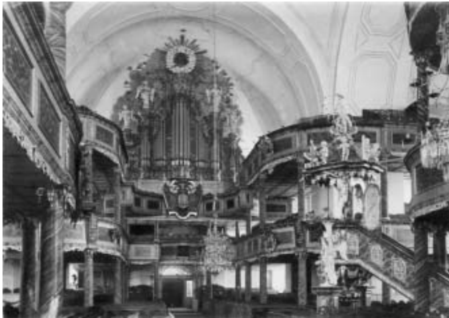
Die Gnadenkirche zur Hl. Dreifaltigkeit in Landeshut/Kamienna Góra

der wissenschaftliche Apparat erstellt. Ende 2003 soll die Druckfassung des Handbuchs vorliegen. Für die Publikation hat die Stiftung für deutsch-polnische Zusammenarbeit bereits jetzt einen namhaften Druckkostenzuschuß bewilligt. Mit der gemeinsam von polnischen und deutschen Kunsthistorikern erbrachten Pionierarbeit wird ein aktuelles und handliches ("reisetaugliches") Nachschlagewerk in deutscher und polnischer Sprache geschaffen, das dem Fachmann wie dem interessierten Laien gleichermaßen zuverlässige, wissenschaftlich fundierte Informationen über die Kunstdenkmäler Schlesiens bietet (eine ausführliche Beschreibung des Handbuchs unter www.uni-marburg.de/herder-institut/sammlungen/bilder.html ).