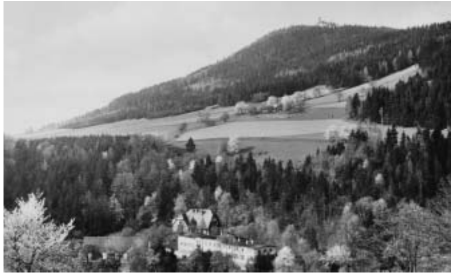
Das Kurheim Urnitztal mit Maria Schnee