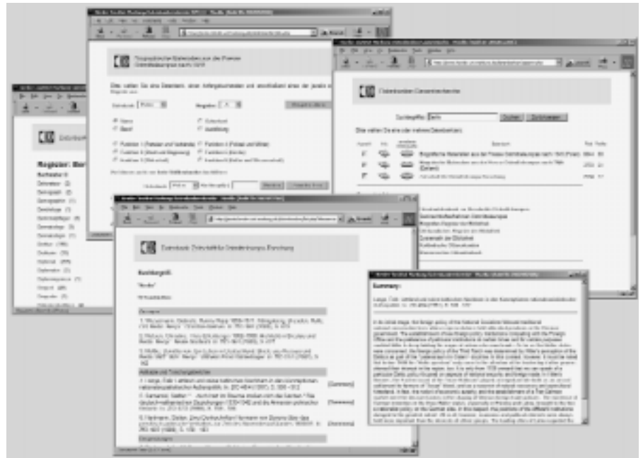
Präsentation der Daten im Internet nach einem einheitlichen Schema

lich macht. Für die Erstellung dieser Datenbank wurde dem Herder-Institut im Rahmen des Projektes eine halbe wissenschaftliche Mitarbeiterstelle für zwei Jahre bewilligt. Die Einrichtung einer solchen "Virtuellen Fachbibliothek" wird sich somit in idealer Weise mit dem Informationsangebot des Herder-Instituts ergänzen.