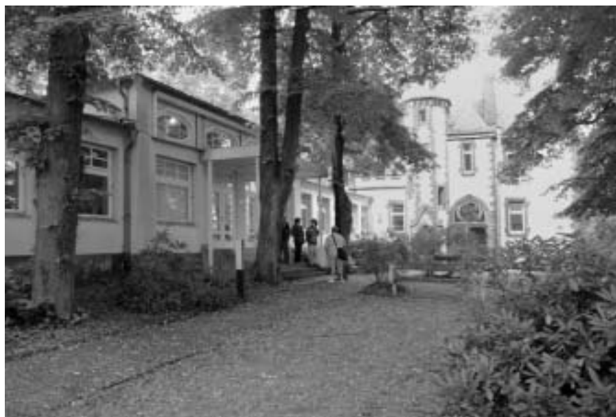
Die ehemalige Villa des Nobelpreisträgers Emil von Behring. Heute wird das Gebäude vollständig vom Herder-Institut genutzt.

Über Bestandsnachweise und digitalisierte Bestandsmaterialien hin-