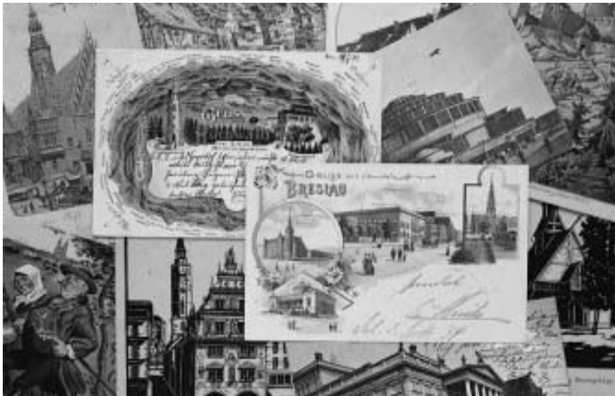
Der jüngst erfolgte Ankauf von 695 historischen Ansichtskarten aus Schlesien stellt eine willkommene Bereicherung der Postkartensammlung dar.

Parallel zur gezielten Ergänzung, Erschließung und digitalen Aufbereitung sowie Präsentation der Bestände des Bildarchivs erfährt die Sammlung II: Bilder-Karten-Dokumente derzeit eine Neustrukturierung in räumlicher und organisatorischer Hinsicht, deren Ziel die Einrichtung eines gemeinsamen Studiensaals mit Katalogen und Findhilfen zur Optimierung von Archivbedingungen und Nutzerservice ist.