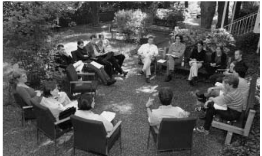
Intensive Arbeit in besonderer Atmosphäre: Die Teilnehmer des Workshops bei der Diskussion im Plenum

Gelegenheit, zu vorher vereinbarten Themen Kurzvorträge zu konzipieren - eine Stadtführung durch Marburg brachte dann nach der intensiven Arbeit etwas Entspannung. An den beiden folgenden Tagen stellten sieben Gruppen ihre Ergebnisse vor, die sodann intensiv diskutiert wurden. Die Frage nach der angestrebten ethnischen Homogenisierung im Mischgebiet zwischen Polen und