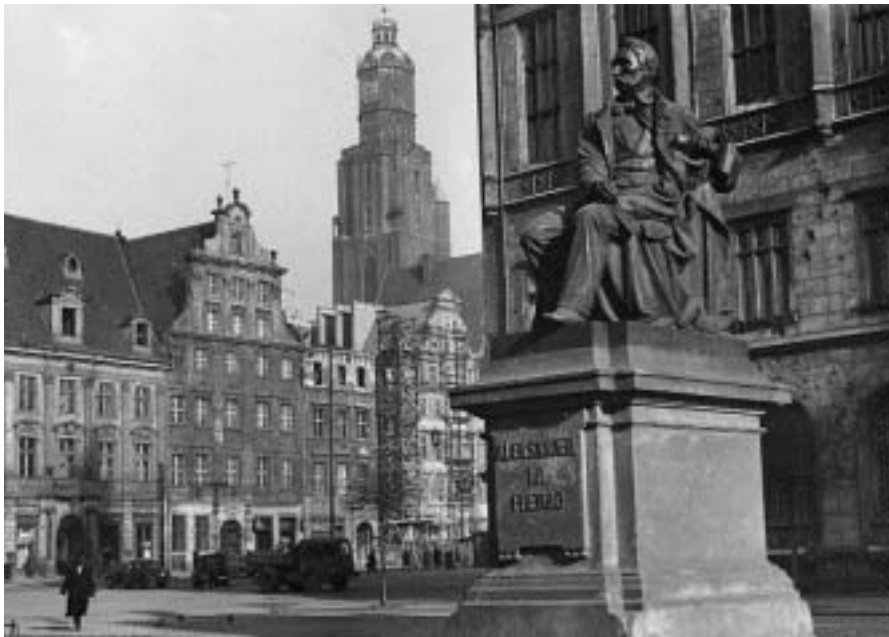
Das aus Lemberg transferierte Denkmal des polnischen Dichters Graf Fredro wurde am 15.07.1956 vor dem Breslauer Rathaus aufgestellt (Foto Juli 1957)