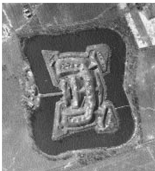
Das 1889 angelegte Fort Gorgast (Ausschnitt aus einer Aufnahme vom 7. April 1945)