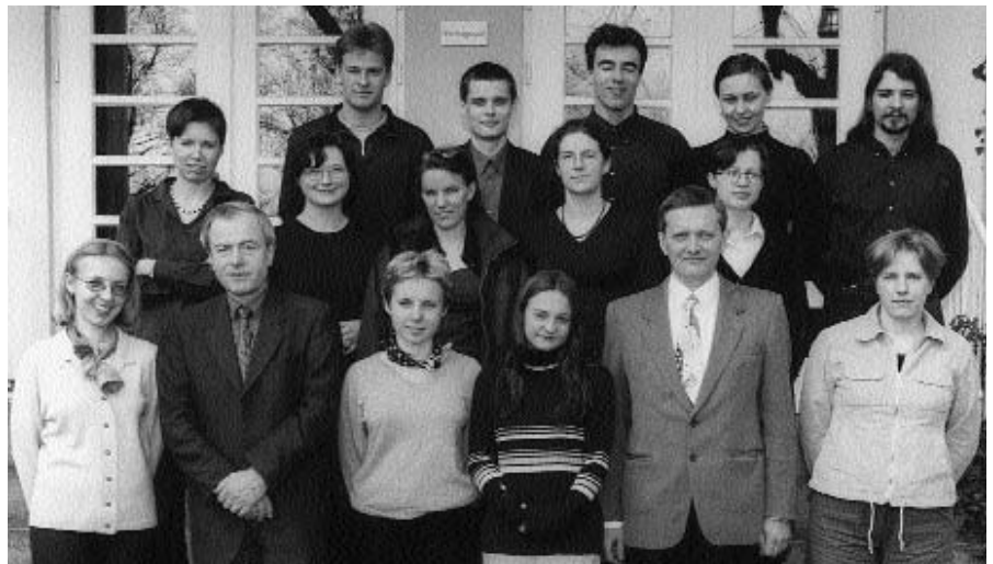
Die Teilnehmer des Workshops

Lebhafte Auseinandersetzungen waren kaum durch unterschiedliche Positionen entlang der Linie deutsch-polnisch bedingt. Doch wurde auch sichtbar, wie sich in dem Untersuchungszeitraum von mehr als einem halben Jahrhundert die gegenseitige Wahrnehmung teilweise erheblich verändert hat. Die gleichberechtigte Verwendung der