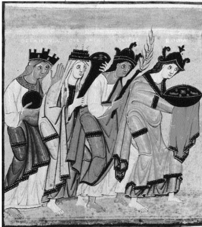
Slavonia, Germania, Gallia und Roma huldigen Kaiser Otto III. (um 1000)

von Gnesen selbst ins Zentrum seiner Ausführungen. In einer beeindruckenden kritischen Musterung der verfügbaren Dokumente führte er vor Augen, was die Quellen zweifelsfrei über den Akt von Gnesen auszusagen vermögen. Daran schloß er die Frage nach der Bedeutung des erkennbaren Geschehens für die polnische Geschichte an, die vor dem Hintergrund der politischen und kirchlichen Situation der piastischen Herrschaftsbildung um 1000 erörtert wurde. Wyrozumski wies in diesem Zusammenhang die These Johannes Frieds zurück, daß in Gnesen der piastische Herrscher von Otto III. zum König gekrönt worden sei. Die in der ältesten polnischen Chronik des Gallus Anonymus geschilderte