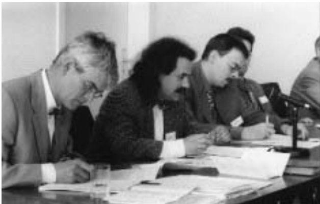
Die Referenten der ersten Sektion