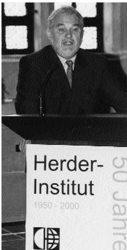
Prof. Dr. Jürgen Kocka

Die sogenannte "Allgemeine Geschichte" könne sich dabei, so Kocka, nur dann zu einer allgemeinen europäischen Geschichte mit globalen Bezügen entwickeln, wenn sie die Fragen und Ergebnisse der Osteuropa-Historiker stärker als bisher berücksichtige. Die besondere Herausforderung Ostmitteleuropas an eine solche Historiographie besteht laut Kocka darin, daß sie eine neuartige Verknüpfung von vergleichender Geschichte und Verflechtungsgeschichte erfordere. Mit Ostmitteleuropa rücke ein Raum ins