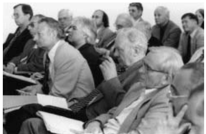
Blick in das Auditorium

Jaroslav Pánek (Prag) untersuchte die Bewertung der frühneuzeitlichen