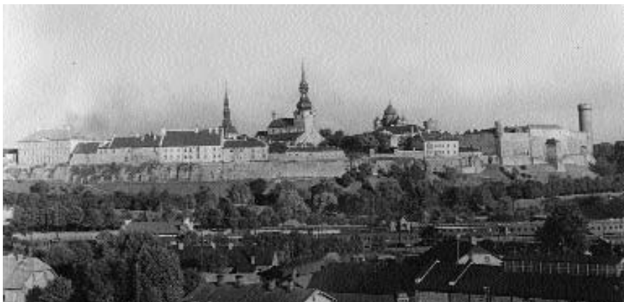
Reval/Tallinn. Der Domburg von Westen um 1910.