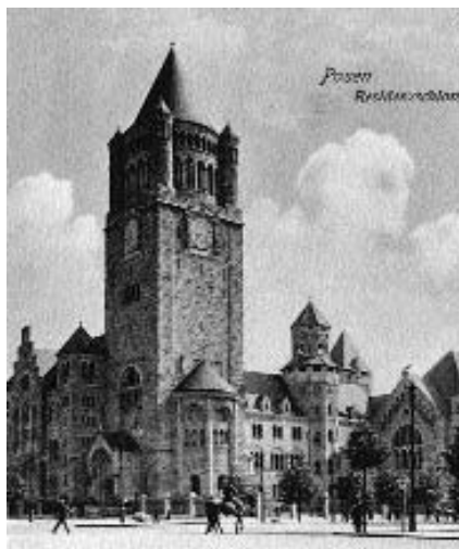
Königliches Schloß. Architekt Franz Heinrich Schwechten um 1904-1910.

Für die Mehrzahl der Besucher waren Name und Werk des Archi-