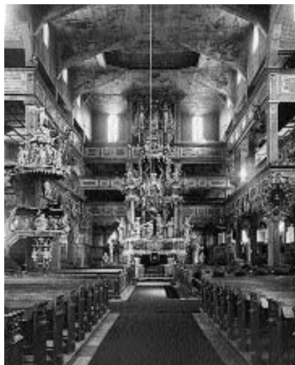
Die Friedenskirche von Schweidnitz